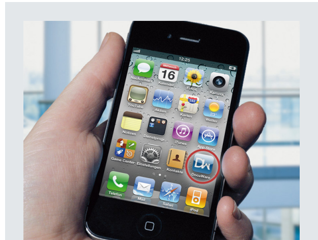
DocuWare als iPhone-App lässt sich kostenlos installieren.

DocuWare Mobile lässt sich mit zahlreichen mobilen Geräten nutzen, so etwa mit dem iPhone, iPad, iPod, auf BlackBerry-Smartphones, auf Geräten mit Windows Phone 7 und Android sowie Tablets mit Windows 8. Der Funktionsumfang kann sich je nach Gerät und Betriebssystem leicht unterscheiden. Bei den mobilen Geräten von Apple haben Sie die Wahl, ob Sie auf das Dokumenten-Management über die App DocuWare Mobile zugreifen oder über einen HTML-5-fähigen Browser wie Safari. Die Installation entfällt beim Browserzugang, jedoch kann die App in der Regel schneller arbeiten als dies per Browser möglich ist. Für BlackBerry- und Android-Geräte ist nur der Browser-Zugang verfügbar; Smartphones mit Windows Phone 7 sowie Tablets mit Windows 8 arbeiten nur mit der App. Mehr Informationen zu Versionen und Funktionen finden Sie unten im Kasten „10 Fragen“ sowie im DocuWare Knowledgecenter unter help.docuware.com/de/#t56052